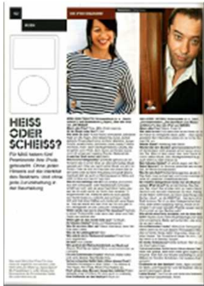
MAX, Thema I-Pod