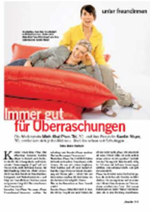
FREUNDIN, „Unter Freundinnen“