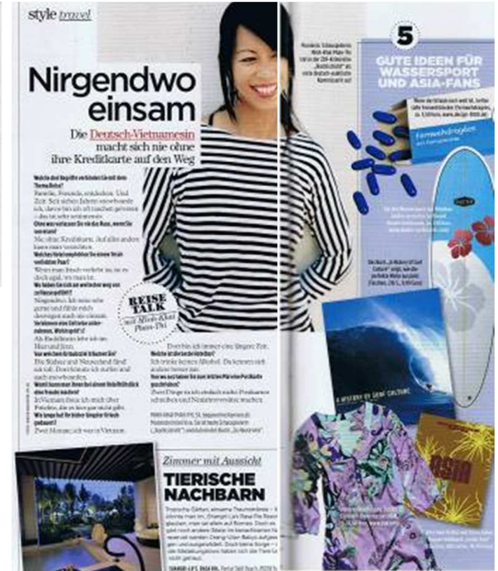
GALA Travel Check