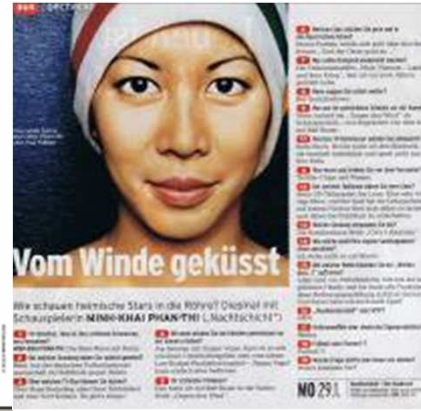
TV Digital „aus gecheckt“