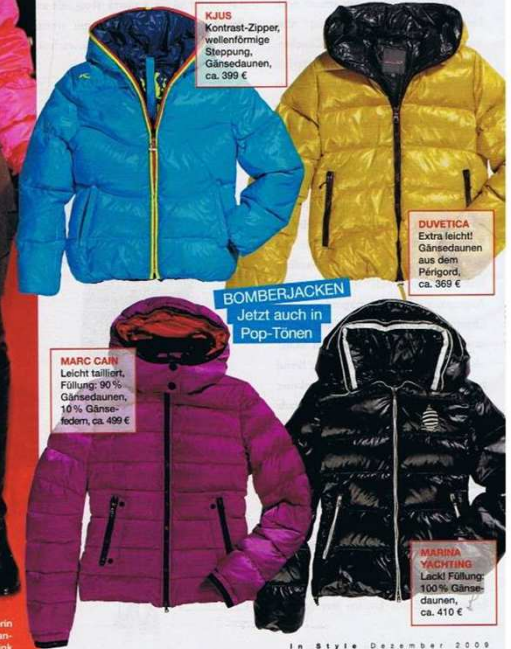
KJUS Kontrast-Zipper, wellenförmige Steppung, Gänsedaunen, ca. 399 €

Warm, wärmer, DAUNENJACKE! Gut verpackt in den Winter – mit dem InStyle-Daunen-Spezial